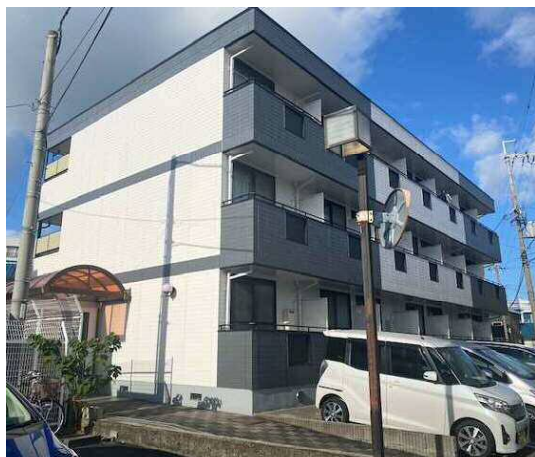
ルミエール箕面Ⅲ 外観